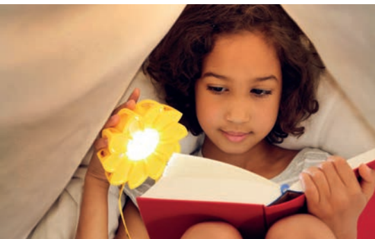
Little Sun